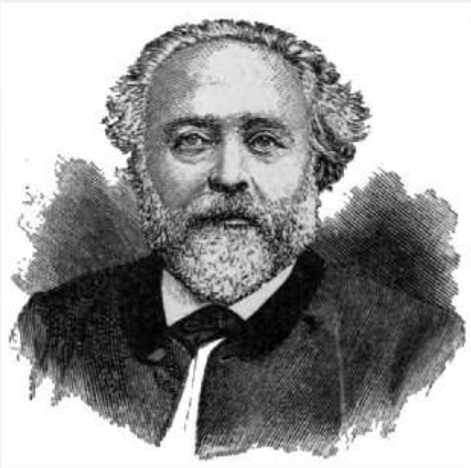
Немецкий писатель Ауэрбах

«Нажить много денег- храбрость, сохранить их- мудрость, а умело расходовать их- искусство».